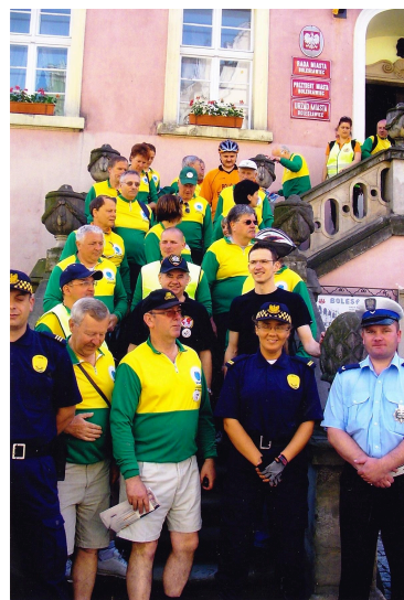
Po spotkaniu z władzami miasta policjanci z Holandii, Niemiec i Polski XVII Międzynarodowego Rajdu Rowerowego IPA w asyście Funkcji SM i RD wyszli na trasę Bolesławiec - Zamek Grodziec - 15.05.2008 r.