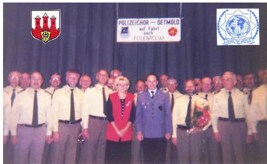
Policyjny chór z Detmold (Niemcy) w Starym Teatrze tuż po koncercie z organizatorami - 5 X 1994 r.

Wszystkie dokonania bolesławieckich członków IPA były zapisywane na konto Regionu IPA Jelenia Góra, bo tam należeli. Ale wśród bolesławieckich policjantów i emerytów zrodził się pomysł, aby wreszcie utworzyć własny Region IPA. Do jego założenia wg Statutu IPA wymaganych było 15