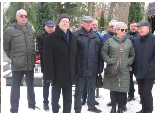
Oprac. J. Landowski