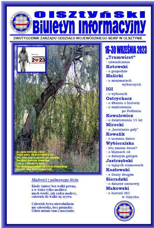
Olsztyński Biuletyn Informacyjny (167)

Zarząd Wojewódzki SEiRP w Olsztynie od 21 maja 2010 r. wydaje "Olsztyński Biuletyn Informacyjny"