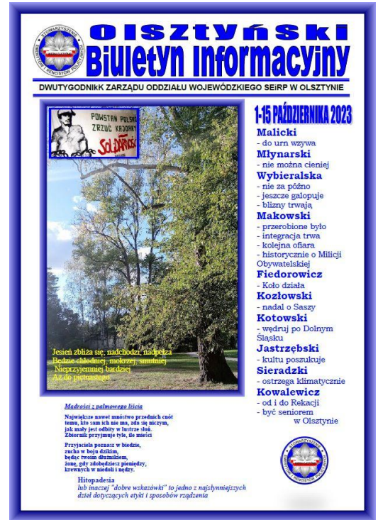
Olsztyński Biuletyn Informacyjny (168)

Archiwum Olsztyńskiego Biuletynu Informacyjnego ZOW Olsztyn znajduje się w sieci na stronie WWW: seirp.olsztyn.pl