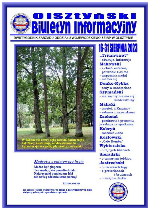
Olsztyński Biuletyn Informacyjny (165)

Zarząd Wojewódzki SEiRP w Olsztynie od 21 maja 2010 r. wydaje "Olsztyński Biuletyn Informacyjny"